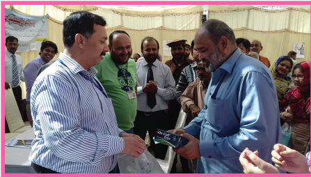
سینیئر منیجر ایڈمنسٹریٹو اور ایچ۔ آر۔ انعامات تقسیم کرتے ہوئے۔