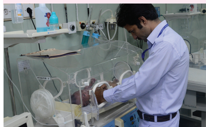
Providing Care to New Born Baby