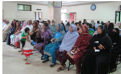
Gyne OPD During Rush Hours

Mother and Child Health Care (MCHC) is one of the topmost priority services in Chiniot General Hospital (CGH). Our MCHC services encompass all the healthcare dimensions of family planning, preconception, prenatal and postnatal care in order to decrease maternal mortality and morbidity and get a healthy outcome in the form of a healthy baby. CGH has state of the art labour room where one to one care is provided to each patient on comfortable birth beds to make their birthing experience pleasant.