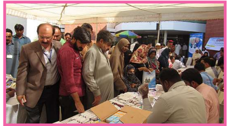
محترم جناب بریگیڈ میجر (ر) حامد حسین خان صاحب ایم ڈی ای، سی۔ جی۔ ایچ کیمپ کا جائزہ لے رہے ہیں