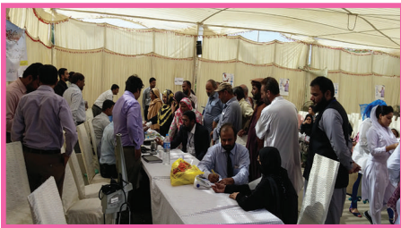
مفت فری ڈیابیطس کیمپ میں ڈاکٹرز مرلیضوں کو معائنہ کر رہے ہیں۔