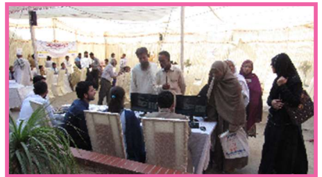
فری ڈیابیطس کیمپ میں شرکاء رجسٹریشن کر رہے ہیں۔