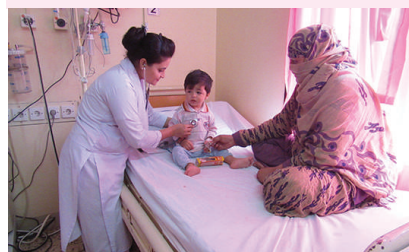
Mother with Child in PEADs Ward