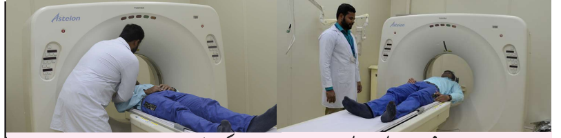
چینیوٹ جنرل ہسپتال میں CT-SCAN کی سہولت دستیاب ہے۔