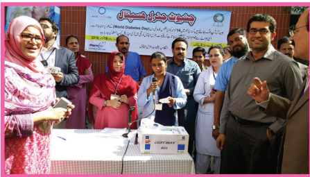
قرعاندازی میں انعامات جیتنے والوں کا نام پکارا جا رہا ہے۔

بی ایم آئی، ہیپاٹائٹس سی، کولیسٹرول اور بلڈ شوگر کے ٹیسٹ مفت کیے گئے۔ کیمپ کے شرکاء میں بذریعہ قریباً 12 سینتے والوں میں گلوکومیٹر تقسیم کیے گئے۔ عوام الناس کیمپ اور اس کے انتظامات سے بے حد مطمئن تھے اور اس کو بھرپور سراہا۔