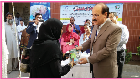
محترم جناب بریگیڈ میجر (ر) حامد حسین خان صاحب ایم ڈی ای، سی۔ جی۔ ایچ قرعاندازی میں جیتنے والوں میں گلوکومیٹر تقسیم کرتے ہوئے۔